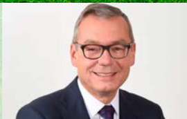
Ruedi Noser FDP Ständerat