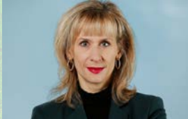
Priska Seiler Graf SP Nationalrätin CO-Präsidentin KLUG