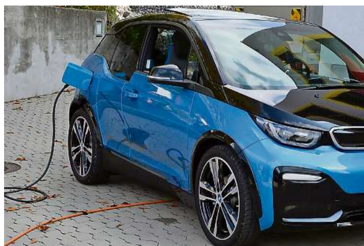
Ein Elektroauto tankt Strom.

TURBENTHAL Investitionen in Schnellladestationen lohnen sich für Private in ländlichen Gebieten noch nicht. Die Gemeinde Turbenthal will diese Lücke schliessen. Sie plant den Bau einer E-Tankstelle, an der innert 20 Minuten für rund 250 Kilometer elektrische Antriebskraft aufgeladen werden kann. Projektleiter Stephan Meister ist überzeugt, dass der E-Mobilität die Zukunft gehört. Der Betrieb der neuen Station soll in rund vier Jahren kostendeckend sein. Als Standort kommen das Gemeindehaus und der Werkhof infrage. tth SEITE 3