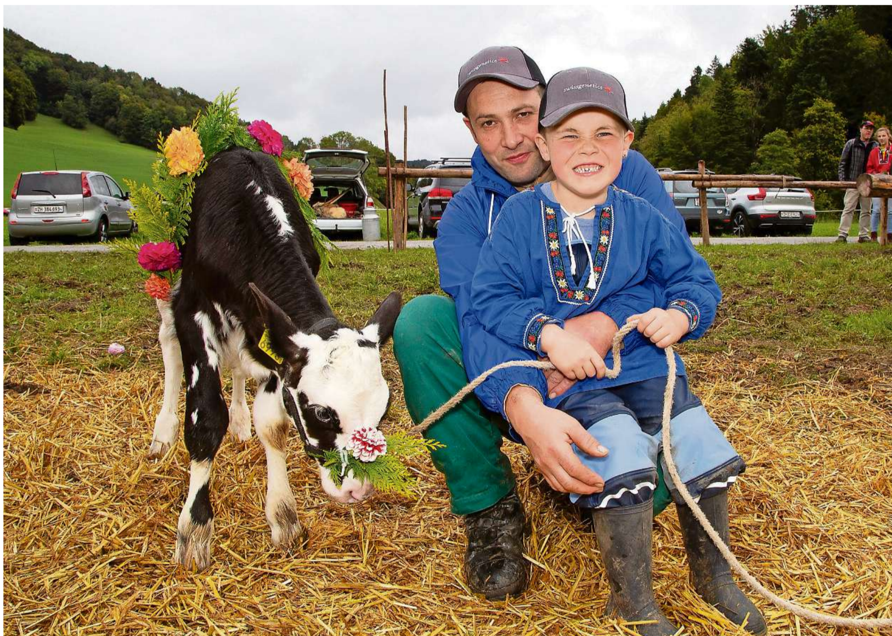
Herausgeputzt in Tracht und Blumenschmuck kamen Jung und Alt mit ihrem Vieh am Samstag an die Wilemer Viehschau in Tablat. Die Alphorngruppe Sternenberg amtierte als Jury, die Kinder führten ihre Kälber vor und sangen auch mal ein Lied. SEITE 4